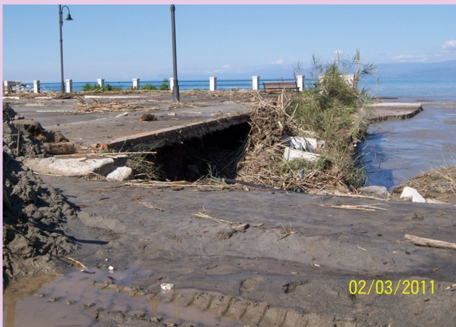
La devastazione dovuta al maltempo dei giorni scorsi

Ancora molti lavori da svolgere per recuperare