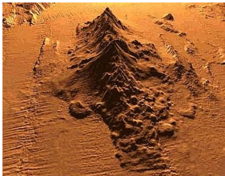
Un foto sottomarina del Marsili

Il Marsili è un vulcano sottomarino che si trova nel mar Tirreno. Esso è stato sco-