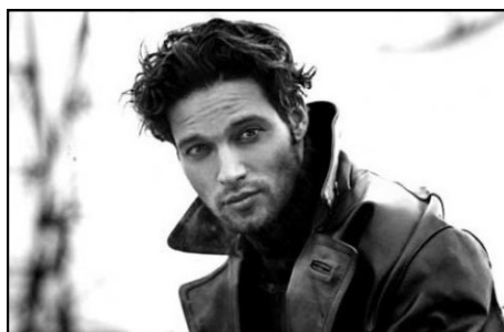
Il sex simbol Gabriel Garko.