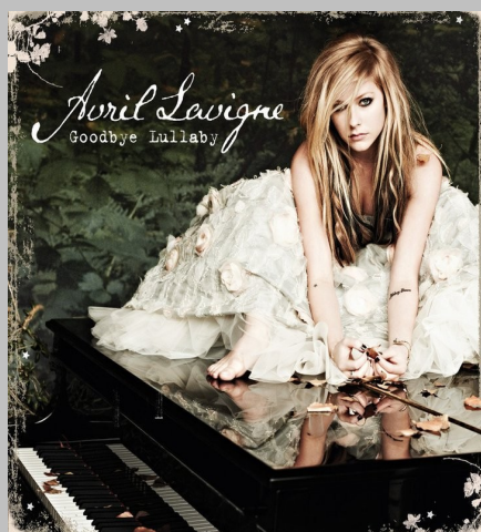
La copertina del nuovo album